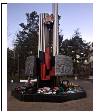
Сквер 40-летия Великой Победы